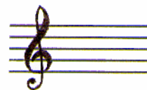
ópera y música

Para ponerse jugar, bastará imprimir la lámina deseada, y tener a mano según en caso: algo con qué escribir, unos lápices de colores o algún otro material para realizar alguna manualidad. En el bajo de cada página queda precisado mediante claros símbolos: